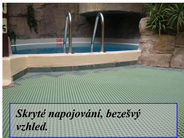
Skryté napojování, bezešvý vzhled.