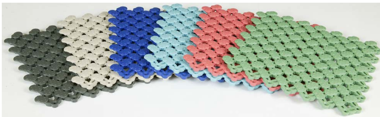
Barvy: tmavě šedá, béžová, tmavě modrá, pastelově modrá, růžová, zelená.

Rohož Lagune nabízí výjimečné odvádění vody a komfort. Zaoblený povrch podporuje okamžité odvodnění. Spodní konstrukce odvádí vodu pryč, čímž vzniká bezpečný a suchý povrch. Měkké a pružné protiskluzové výčnělky na povrchu rohože zajišťují pohodlný polštář pro bosé nohy.