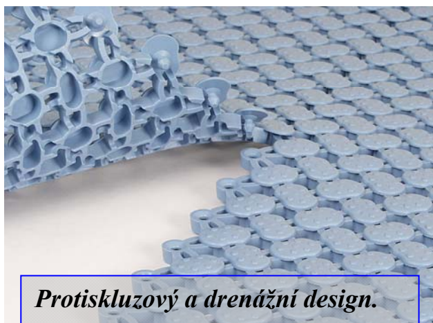
Protiskluzový a drenážní design.